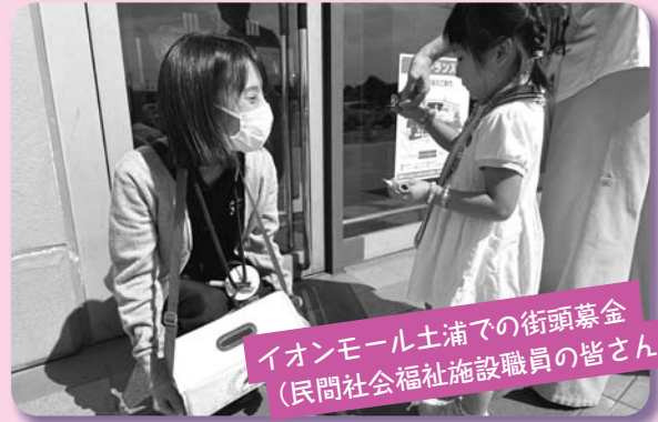
イオンモール土浦での街頭募金 (民間社会福祉施設職員の皆さん)

9,218,340円のご協力をいただきました。 で協力いただいた企業や団体等です。