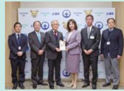
▲筑波銀行 扇の会 様