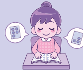
～ひまわりの会 活動の様子～