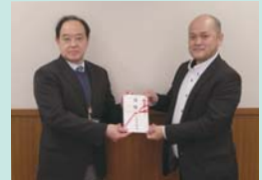
▲土浦地域労働者福祉協議会 様