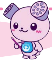
土浦市イメージキャラクター つちまる