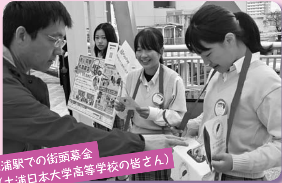
土浦駅での街頭募金 (土浦日本大学高等学校の皆さん)