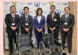
▲みとしん経営研究会、みとしん青年重役会、みとしん資産活用研究会合同チャリティーオープンゴルフコンペ 様