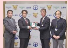
▲ヤマト運輸株式会社 茨城主管支店 様