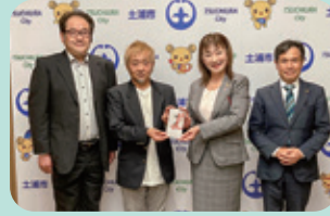
▲神立商工振興会 様