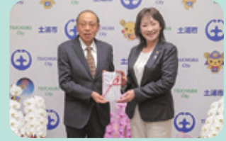
▲土浦市防火・危険物安全協会 様