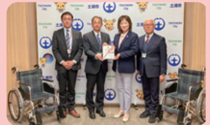
▲みとしん経営研究会・みとしん青年重役会・みとしん資産活用研究会合同チャリティーオープンゴルフコンペ 様